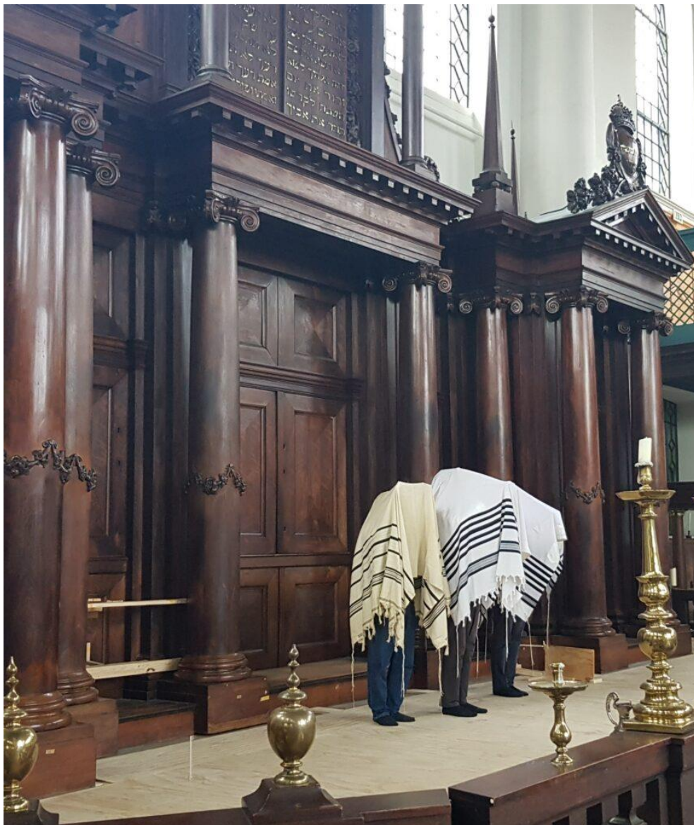
De priesterzegen in de Esnoga, zondag 8 augustus 2021 – eerste dag Rosj Chodesj Elloel 5781

Er is gedoechend in Amsterdam op een doordeweekse dag. In de Portugese synagoge voltrok zich op zondagmorgen 8 augustus 2021 een unicum. Kohaniem (priesters) spraken hun zegen uit op een werkdag. De Amsterdamse Sefardiem zijn bekend om hun vele uitzonderlijke, eeuwenoude tradities die nergens ter wereld bestaan. Sinds vandaag hebben ze er een uitzondering aan toegevoegd.